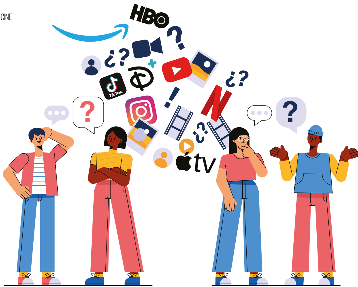
Ilustración creada a partir de imágenes de: pikisuperstar / freepik.com