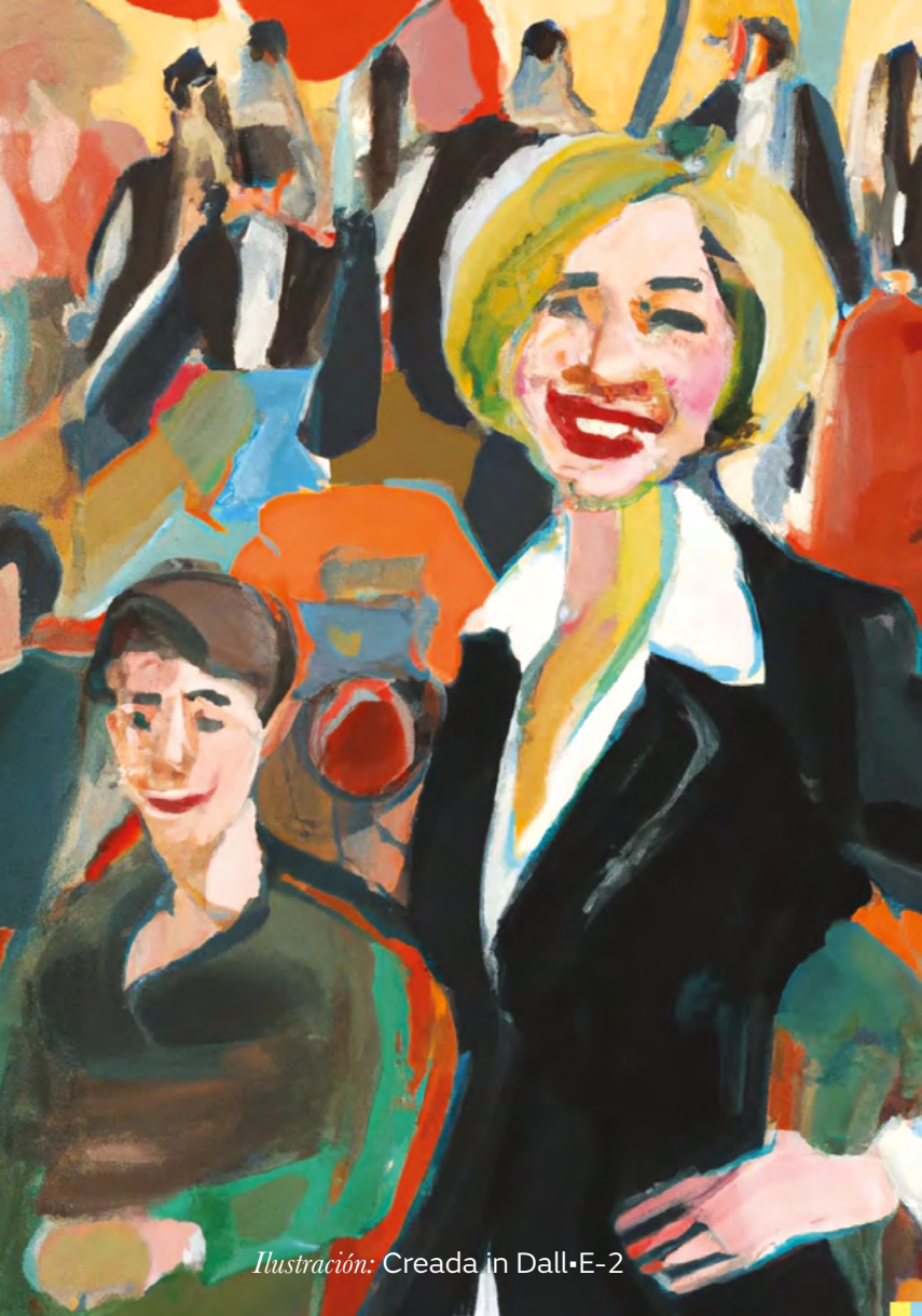
Ilustración: Creada in Dall·E-2

Los Grupos de Atención Prioritaria (GAP) se conforman de: