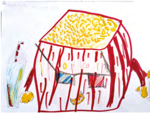
Dibujo: Lucas Romero Veracruz