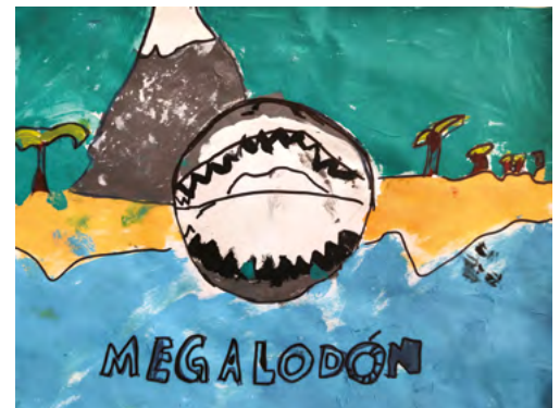
Dibujo: Autor Anónimo