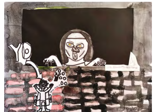
Dibujo: Julio A. Mendoza / Rodrigo Mota / Beto