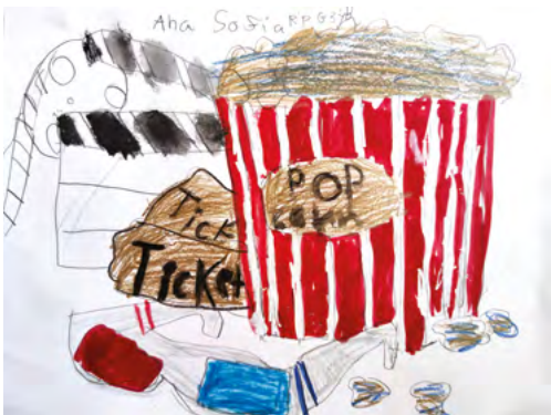
Dibujo: Ana Sofía RP.