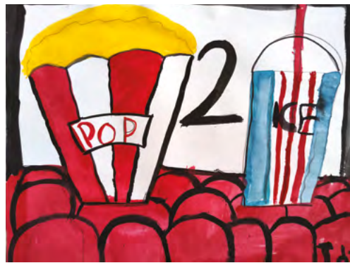
Dibujo: Autor Anónimo