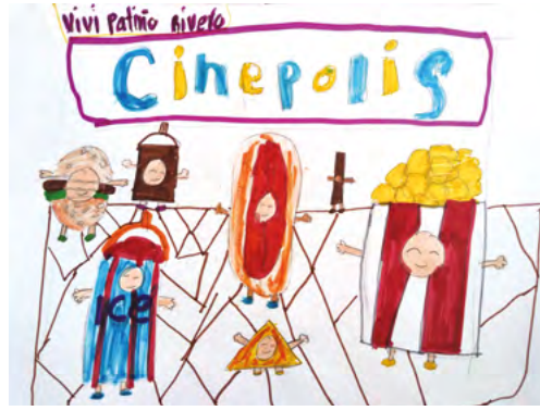
Dibujo: Vivi Patiño Rívero