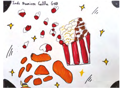
Dibujo: Inés Ramírez Castilla